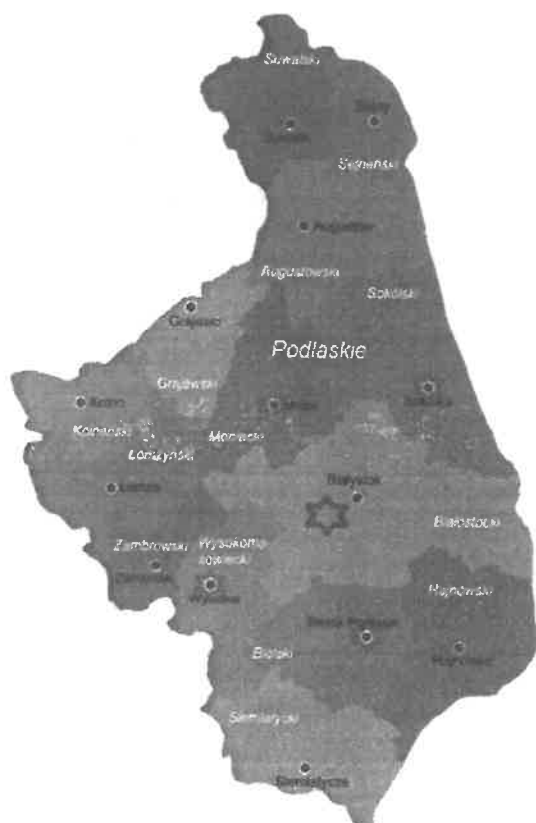
Rysunek 1. Wykaz szpitali I stopnia PSZ sąsiadujących z SP ZOZ w Łapach

Źródło: Opracowanie własne na podstawie umów zawartych z POW NFZ, stan na dzień: 31.12.2021 r.